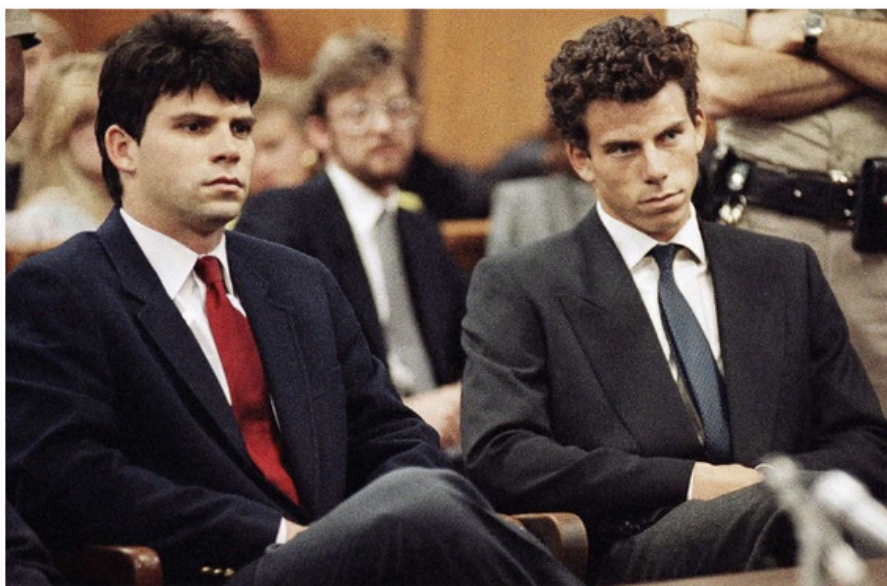
Lyle, à gauche, et Erik Menendez au tribunal de Beverly Hills, en mars 1990.